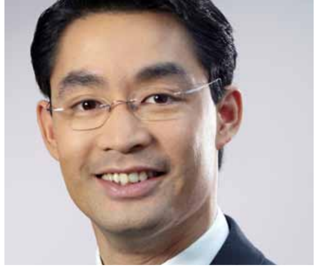
Dr. Philipp Rösler

Göçmenler Almanya'nın ekonomik gelişimi ve refahı için çok büyük katkı sağlıyorlar. Günümüzde yılda yaklaşık olarak 400.000 olan yeni girişimci sayısının üçte birini göçmen kökenliler oluşturmaktadır. Girişimler sektörel anlamda artan bir çeşitlilik göstermektedir. Göçmenlerin geleneksel olarak aktif olduğu perakende ve gastronomi sektöründe bir azalma yaşanırken, daha iyi bir eğitim gerektiren hizmet sektöründe ise bir artış söz konusudur.